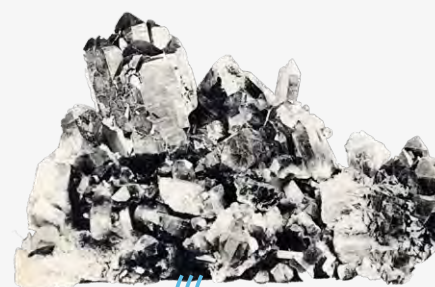
Cristaux de diamant d'Alençon musée de la maison d'Ozé, photo R. Crolard, Alençon, sd, 14 x 9 cm AMA 4FI3711

Bien que dominé par les plus hauts reliefs de la France du Nord-Ouest (forêt d'Écouves et forêt de Multonne), le territoire communal d'Alençon est peu accidenté, son point culminant se trouvant à 152 mètres. Le point le plus bas (127 mètres) se situe à la limite du département de la Sarthe, de Saint-Germain-du-Corbéis et de Condé-sur-Sarthe.