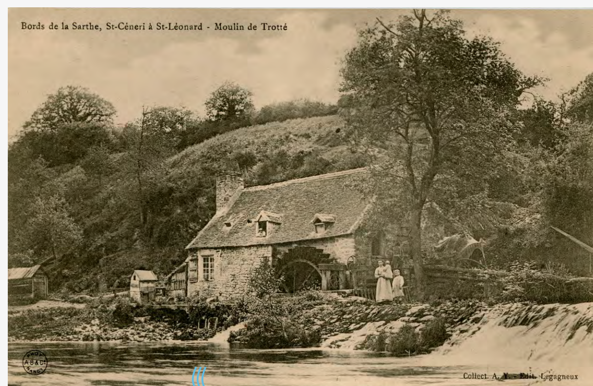
Bords de Sarthe, Saint-Céneri-le-Gérei à Saint-Léonard, moulin de Trotté carte postale, collect. AY édit. Legagneux AMA 4FI6491