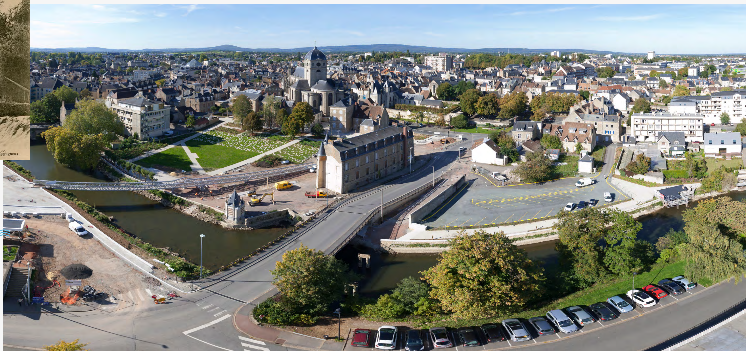
La Providence vue depuis les tours du Champ-Perrier 28 septembre 2015, Olivier Héron AMA 4NUM23787