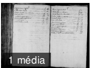
Table (S à T). 3NUM/6372 , 1794-1795

Contexte : ÉTAT CIVIL > REGISTRES DES NAISSANCES > Registre des actes de naissance (1er janvier - décembre 1911).